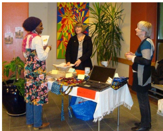
I samspråk med samordaren för AIDS-dagen

"Uppsalagruppen" kallar vi några entusiastiska medlemmar i Uppsala. De tar ofta tillfället i akt att presentera ZASP. Det kan vara på arbetsplatsen, i kören, i syjuntan, i andra föreningar m.m. Då passar de också på att sälja zambiskt hantverk från ZASP-shopen. I höst har de haft ZASP-dag med loppmarknad i Fyris Park. På Aidsdagen den 1 dec. deltog ZASP i Katedralsskolan tillsammans med andra föreningar som arbetar med aidsfrågor.