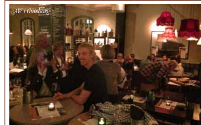
AW i Göteborg