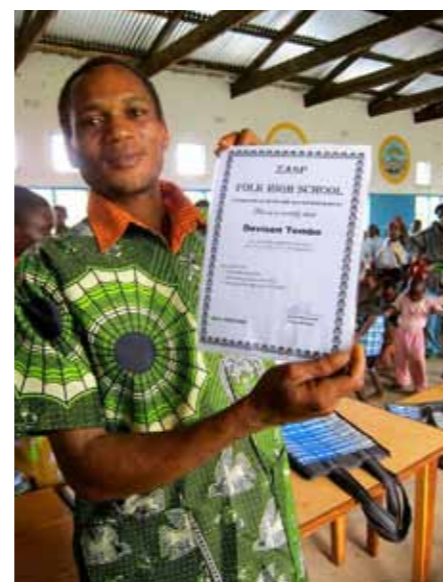
För 200 kronor ge en zambisk bybo möjlighet att gå en folkhögskolekurs hos Zasp.

Du kan också maila lina.ludwigson@zasp.se om du har några frågor.